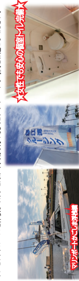
マリナーボートでの海遊体験

サンセットクルーズを体験してみませんか？大切な方や友人とプライベートな時間を過ごしてください。