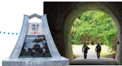
ハート型の 絵馬がある