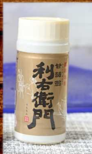
焼酎 500円 Liqueur