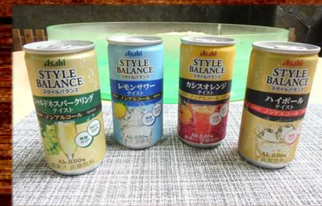
ノンアルコール飲料 300円 Non alcoholic drink