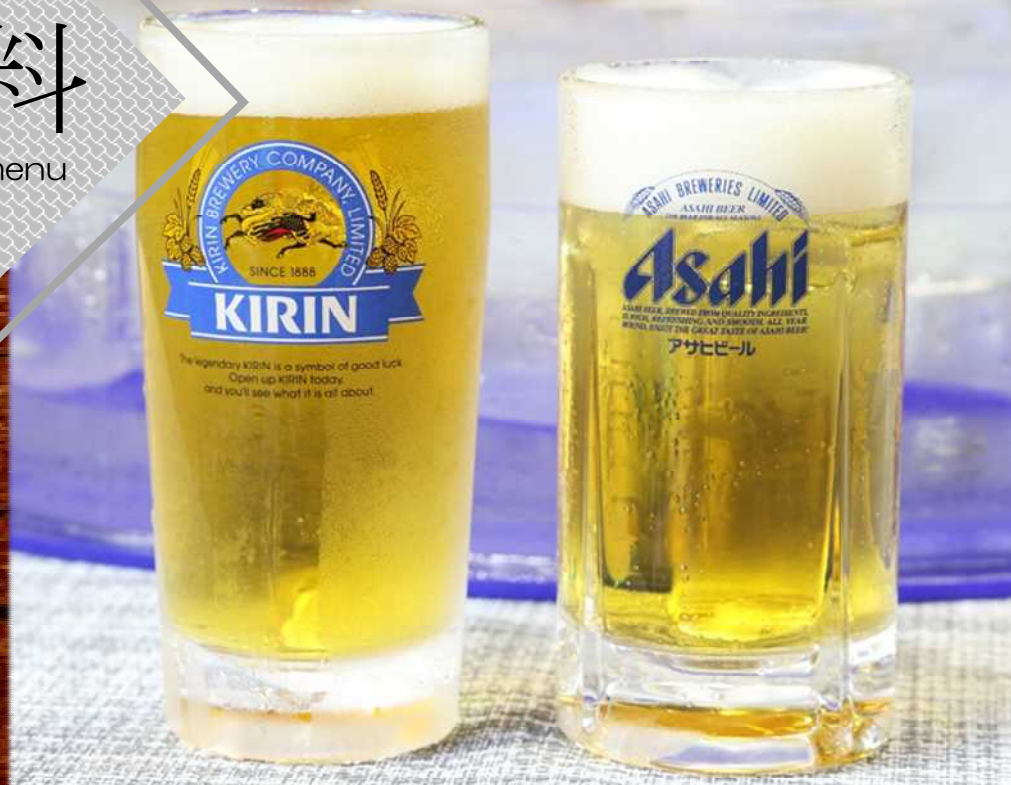
生ビール (キリン/アサヒ) 800円 Draft beer (KIRIN or Asahi)