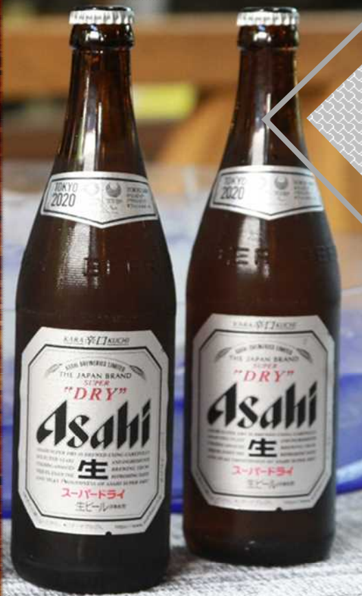
瓶ビール 800円 Bottled beer