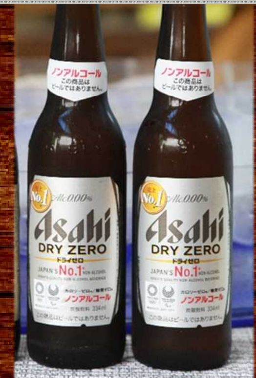
ノンアルコールビール 500円 Non alcoholic beer