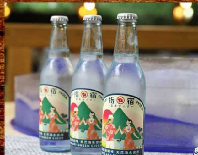
指宿温泉サイダー 300円 Ibusuki spa cider