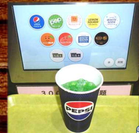
ドリンクバー 300円 Drink bar