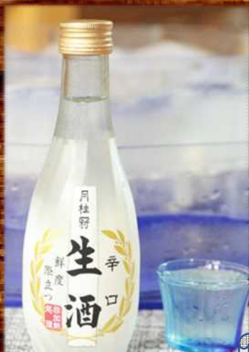
冷酒 700円 Cold sake