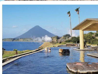
“玉手箱温泉”和式露天浴池

在这裡，可以饱览自然美景，尽享温泉奢华。泉質為鈉氯化物強鹽泉。具有緩解神經痛、肌肉痛、關節痛、肩周炎、運動麻痺、疲勞及增進健康的功效。