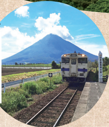
JR日本最南端的车站 西大山站