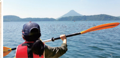
池田湖的水上活动