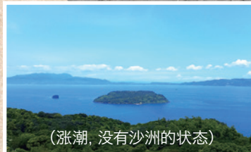
(涨潮，没有沙洲的状态)