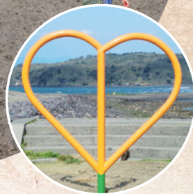
沙洲入口处的 “Chirin's Heart”