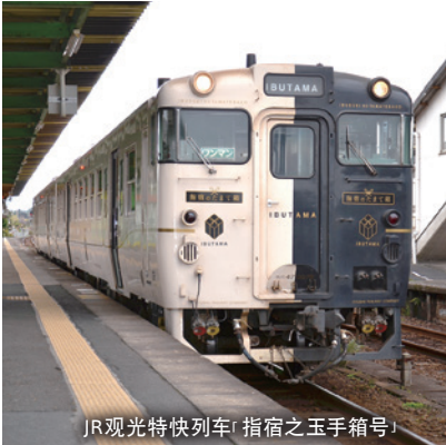
JR观光特快列车「指宿之玉手箱号」