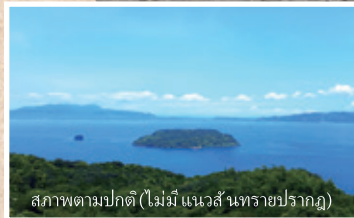
สภาพตามปกติ (ไม่มีแนวสันทรายปรากฏ)