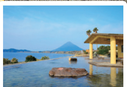
สถานที่อาบน้ำกลางแจ้งสไตล์ญี่ปุ่น “ทามาเตะบาโคะ ออนเซ็น”

สถานที่อาบน้ำกลางแจ้ง(ไร้หมวกบุโรระ)ที่ท่านจะได้สัมผัสกับทัศนียภาพอันงดงาม พาในยามแห่งธรรมชาติอันยิ่งใหญ่และความมหรรศจรรย์ของออนเซ็น คุณลักษณะของออนเซ็นแห่งนี้ เป็นน้ำแร่ธรรมชาติที่มีเกลือเข้มข้นของ โซเดียมและคลอไรด์ มีประสิทธิภาพบำบัดอาการเจ็บปวดกล้ามเนื้อ, ปวดตามข้อ, ปวดหัวไหล่แบบกระทันหัน, ไม่มีแรงออกกำลังกาย, ฟันฟูสภาพร่างกายที่เหนื่อยล้า, สร้างเสริมสุขภาพและอื่นๆ