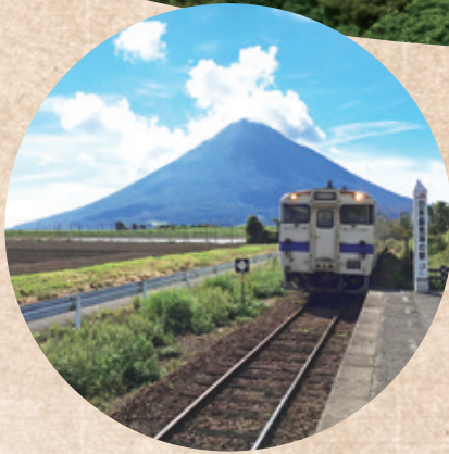
สถานีรถไฟโทชิโอยามะ สถานีรถไฟJRทางตอนใต้สุดของญี่ปุ่น