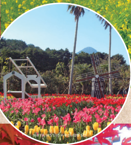
ฟลาวเวอร์บาร์ค คะงะซะชิ มิยะ

▼ ฟุโดซัง เซริ วจิ สวนสไตล์ญี่ปุ่นอันงดงามนำชมที่ วบรี เวนด์ ภายในบริเวณพื้นที่ประมาณ 69,421 m 2 ที่อยู่ในขุนเขาซึ่งมีความสูงจากระดับน้ำทะเล 300 เมตร แห่งนี้มีสวนสไตล์ญี่ปุ่นที่กว้างขยายไปโดยทั่วซึ่งถูกสร้างขึ้นโดยพระภิกษุสงฆ์ของวัด แต่งแต้มด้วยสีสันอันสดใสงดงามของดอกไม้บานาพันธุ์แห่งฤดูกาลทั้งสี่