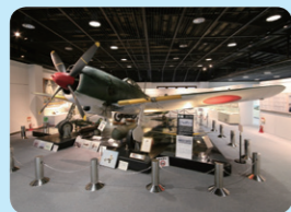
知覧 特攻平和会館

麓一帯を庭園化した美しい町並みで、古来より「薩摩の小京都」とたえられている。昭和56年に国の「重要伝統的建造物群保存地区」に選定され、7庭園は国の「名勝」に指定されています。 問い合わせ先 知覧武家屋敷庭園有限責任事業組合 ☎0993-58-7878