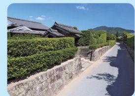
知覧 武家屋敷庭園

麓一帯を庭園化した美しい町並みで、古来より「薩摩の小京都」とたえられている。昭和56年に国の「重要伝統的建造物群保存地区」に選定され、7庭園は国の「名勝」に指定されています。 問い合わせ先 知覧武家屋敷庭園有限責任事業組合 ☎0993-58-7878